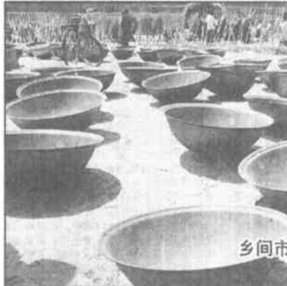
乡间市场

就要下车了，抬头瞥见车窗上方的一行标语：文明之风吹遍车厢。但愿这辆文明快车能把这股文明之风带到小城的每一条街巷，但愿文明之风吹遍社会的角角落落，因为我看到了，当那位小伙子站起来以后，很多人也已经做好了那样的准备。（李敬）