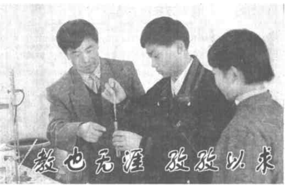
《教学常规细则》等一系列科学的管理制度。师生的工作学习热情空前提高。上初中连续四年被评为“广饶县教学工作先进单位”。

1992年，韩庆敏担任了上初中副校长。他勇于开拓，锐意进取，果断地推行了全员负责制，相继出台了《教学评估量化积分制》、