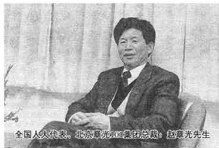
全国人大代表、北京章光101集团总裁：赵章光先生

产品的发展使企业在规模上取得了质的飞跃。1993年3月以北京、浙江、郑州三厂为核心的北京章光101集团宣告成立。当时国务院总理李鹏亲笔题词：“祝贺北京章光101集团成立，为造福患者再做贡献！”并为赵章光先生颁发奖杯，表彰他为